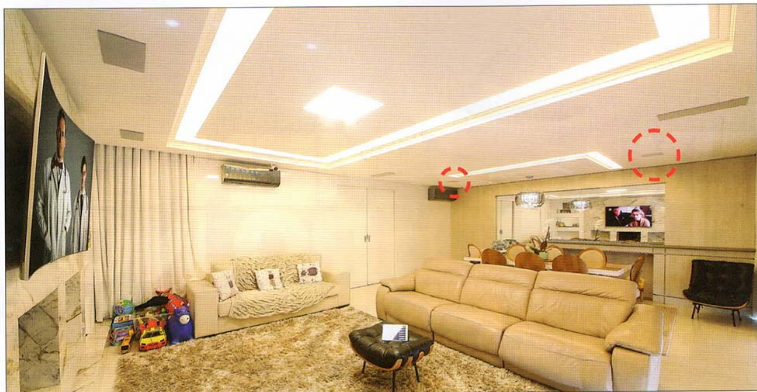
Preso ao painel de mármore, o TV de tela curva aumenta o campo de visão. Ao fundo, duas caixas embutidas no forro de gesso (detalhe) atendem a sala de jantar.